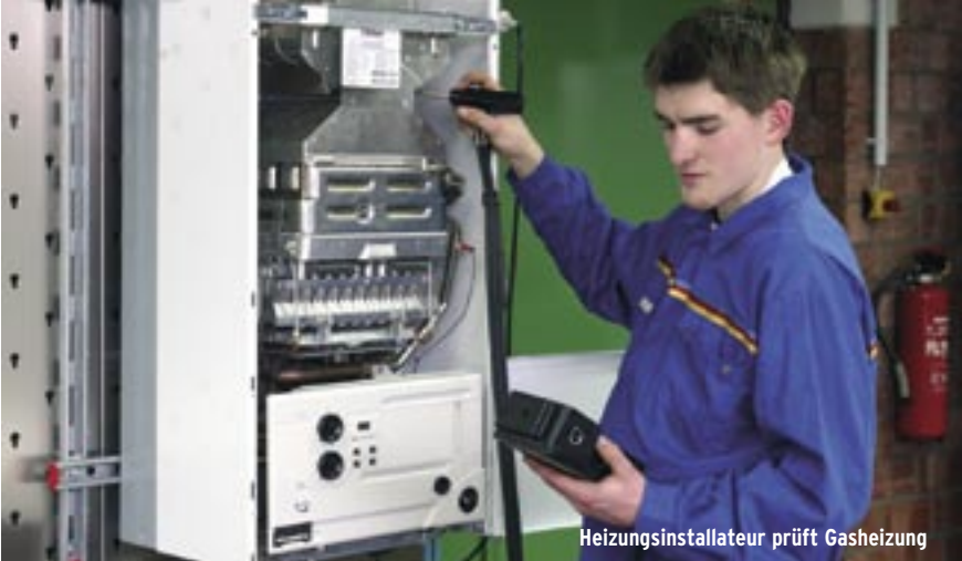
Heizungsinstallateur prüft Gasheizung

Ergebnis ist gleich: weniger Energieverbrauch. Die Energieeffizienz lässt sich in erster Linie durch effizientere Technik steigern. Doch effiziente Technik allein hilft nicht – alle können aktiv werden und Energie einsparen: Der Kühlschrank muss nicht größer sein als nötig oder mit arktischen Temperaturen laufen, und überheizte Räume sind oft sogar ungesünder.