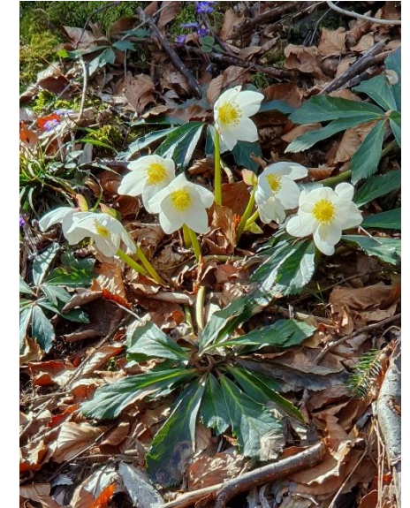
Die Schneerose – ein Winterblüher